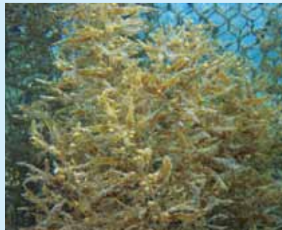
藻場ブロックから海藻が生えている様子