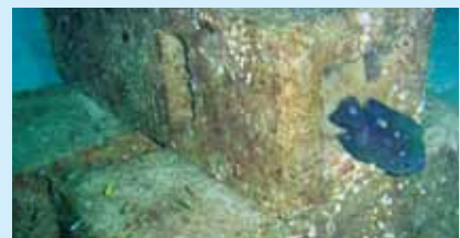
漁礁ブロックにつく魚