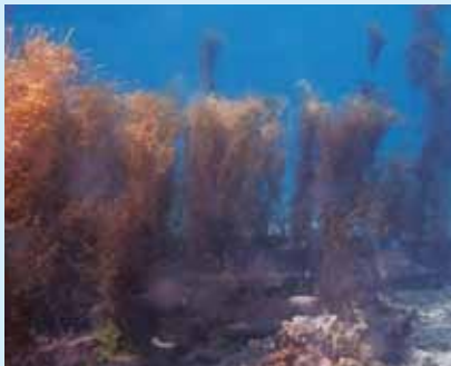
藻場ブロックから海藻が生えている様子