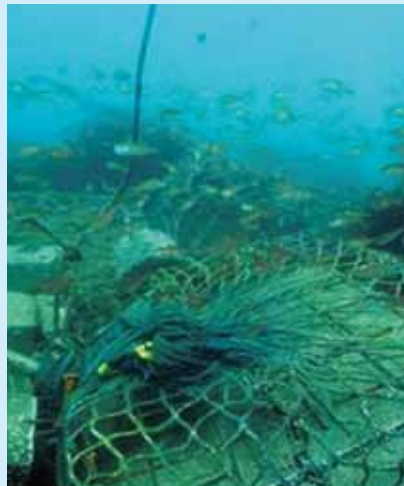
漁礁ブロックにつく魚