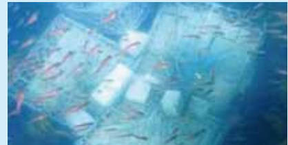
漁礁ブロックにつく魚