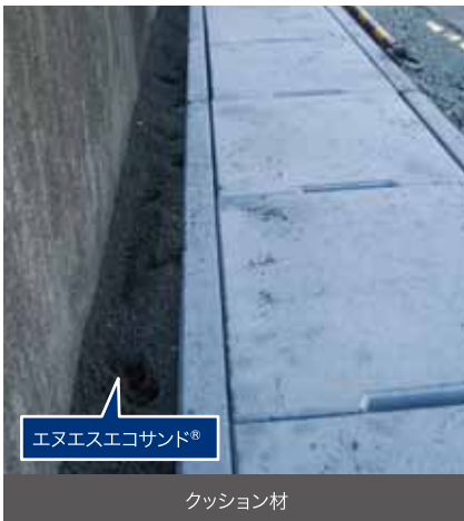
エヌエスコサンド®